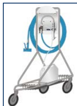
sur chariot inox