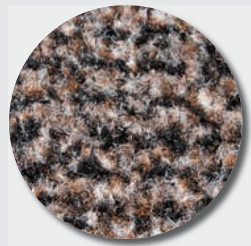
Fibres grattantes + absorbantes mouchetées