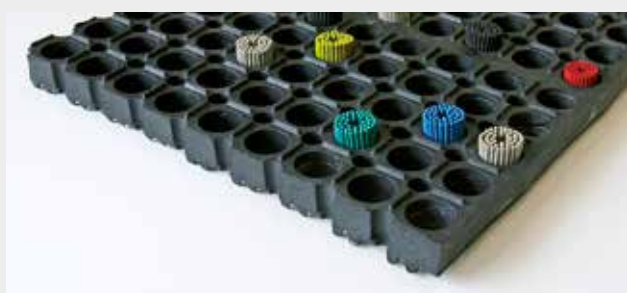
M26 + brosses