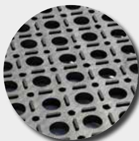
Face inférieure M6080BB