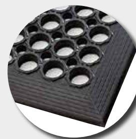
Face supérieure M24