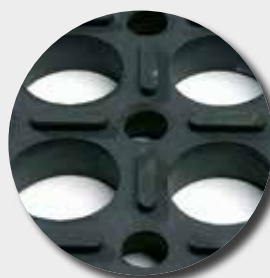
Face inférieure M24