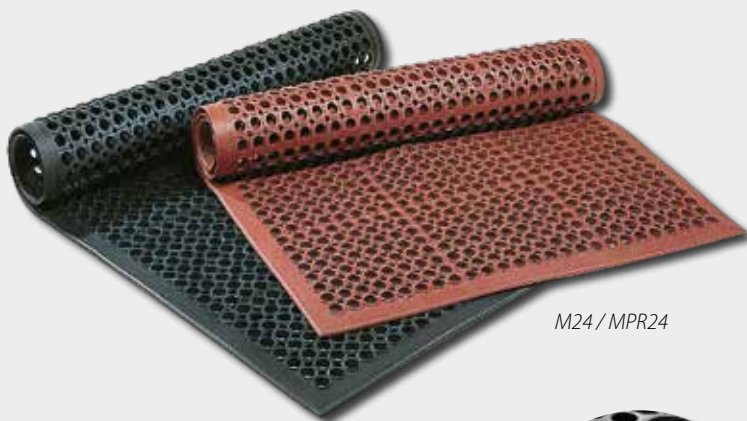
M24 / MPR24