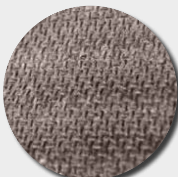
Semelle gel latex