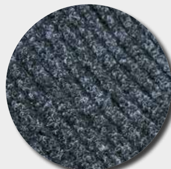
Fibres grattantes et absorbantes