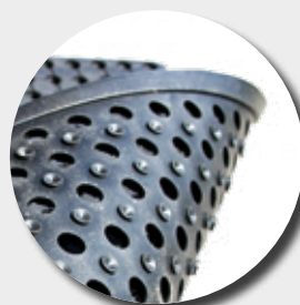
Face inférieure avec ventouses