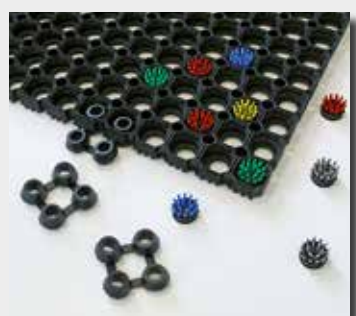
Brosses + jonctions