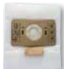
1 x sac microfibre